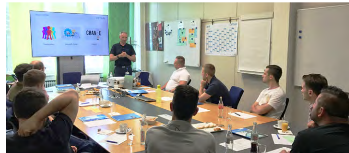
Neue Mitarbeiter im interaktiven Einführungsseminar.

Aufgrund der Corona Pandemie wird das Einführungsseminar aktuell digital abgebildet. Sobald es die Situation zulässt, werden wir wieder auf Präsenz umsteigen.