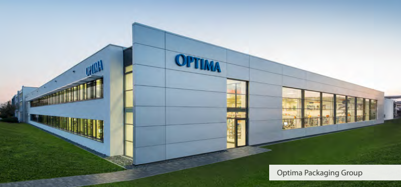
Optima Packaging Group