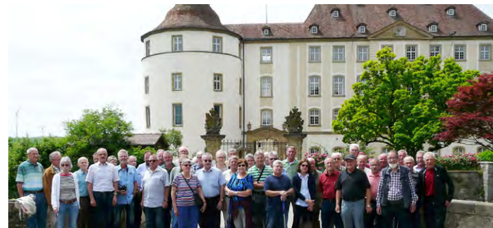
Die Optima Senioren vor dem Schloss in Langenburg (2018).

Für die Ruheständler organisiert ein Team ehemaliger Optima Mitarbeiter dreimal jährlich einen Seniorenstammtisch. Dieses Treffen findet abwechselnd jeweils nachmittags an einem Dienstag, Mittwoch oder Donnerstag statt. Das Programm ist sehr vielfältig und umfasst Besichtigungen von Firmen, Museen und Kirchen und endet mit einem gemütlichen Zusammensein in einer Gaststätte. So wurde beispielsweise das Automuseum in Langenburg besucht. Optima unterstützt die Treffen.