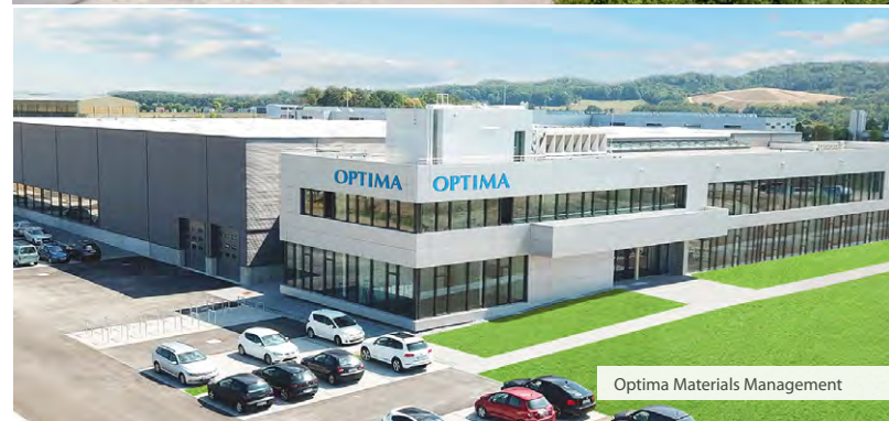
Optima Materials Management