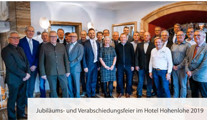
Jubiläums- und Verabschiedungsfeier im Hotel Hohenlohe 2019