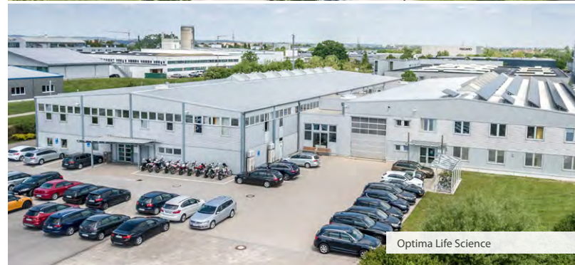
Optima Life Science