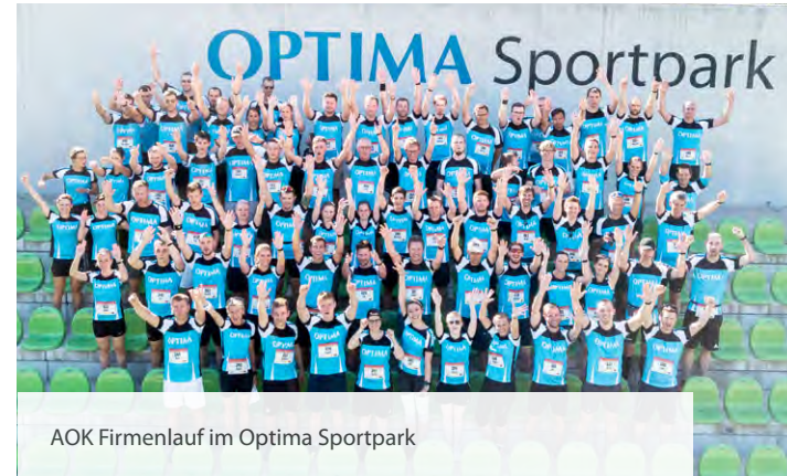
AOK Firmenlauf im Optima Sportpark

Optima fördert die Teilnahme an verschiedenen Laufveranstaltungen wie zum Beispiel am Haller Dreikönigslauf, Crailsheimer Halbmarathon, AOK Firmenlauf in Schwäbisch Hall und am Marathon in Niedernhall. Gefördert werden auch die Tour de Hohenlohe und Optima Bike Challenge für die Fahrradbegeisterten.