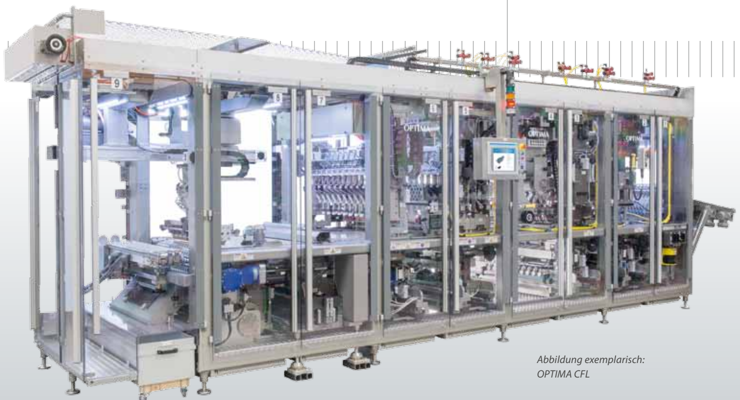
Abbildung exemplarisch: OPTIMA CFL